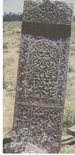
Ahlat Mezar Taşlarından görüntüler.

B. Karamağaralı, 1992: res. 253. Kat No.42. ve res. 236. Kat.No.33.