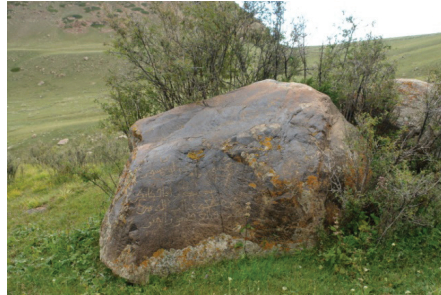
Resim : "Tosor" Yazıtının çizimleri ve orijinal görünümü

Söz konusu yazıtta iki kişi arasında birbirlerine hitabederken "kutlug" yani Tanrı tarafından kendilerine yönetme yetkisi (devletli; halk) bahşedilen anlamda kullanıldığı da açıktır. İşte bu anlayıştan dolayıdır ki devletli olmak "idi kut" veya "kutluk" deyiminin de gösterdiği gibi kutsaldır. Bunun yanında ilgili yazıtta yer alan metnin muhtevasında Karahanlılardaki arazi yönetiminde özel mülkiyetin varlığı yanında, İslâmî mirî arazi statüsünün ve Selçuklular vasıtasıyla Karahanlılarda da uygulanan ikta sisteminin taş üzerinde kalan bir örneği olarak da vasıflandırmak gerekir.