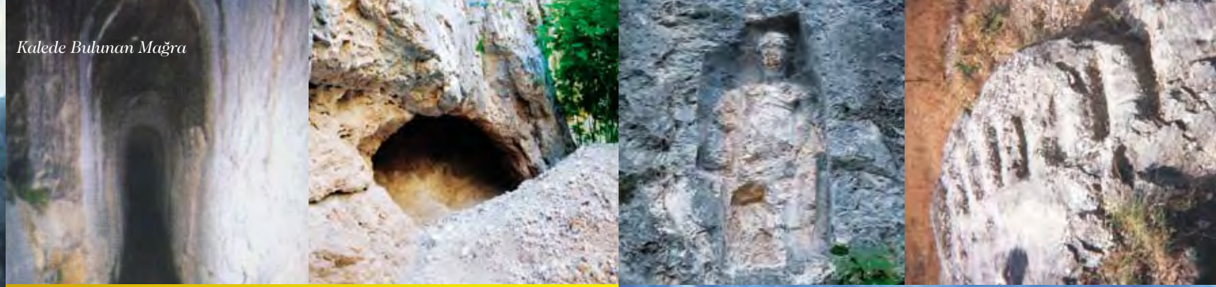
Kalede Buhman Mağra

Yamaç kayaları üzerine işlenmiş, 1.5 metre yükseklikte Hitit Medeniyeti dönemi bereketive bolluğusimgelleyen "Bereket Tanrıçası" kabartmasından, bölgenin, M.Ö. 2. yüzyılda avlak olarak kullanıldığı da tespit edilmiştir.