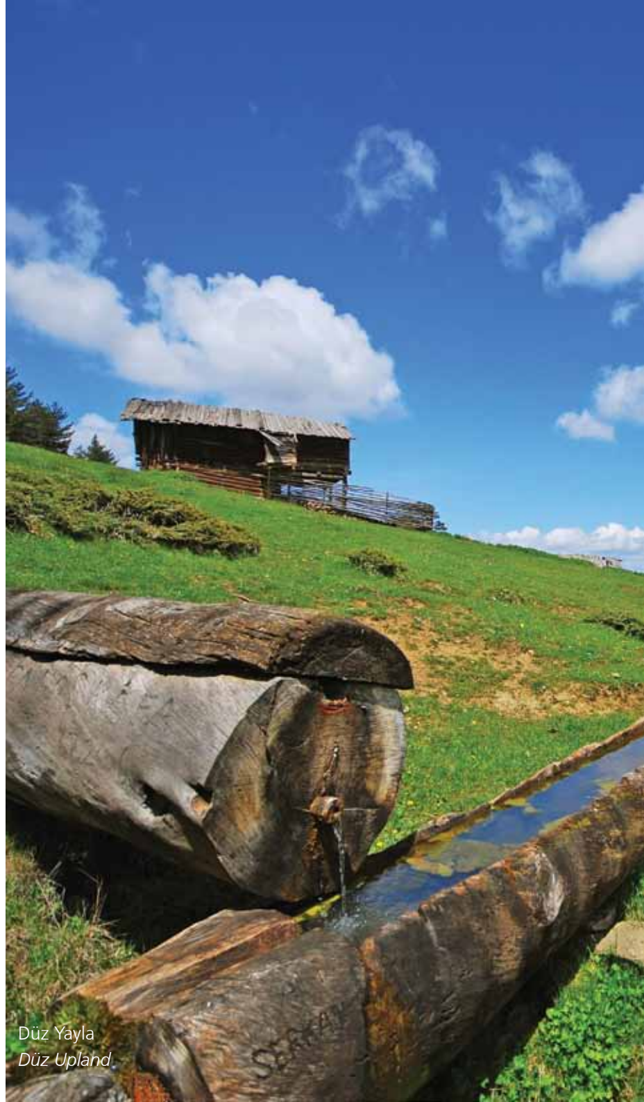
Düz Yayla Düz Upland

İlçenin en önemli yaylaları Kuşçaçimen ve Çerkeş'tir. Çam kokusu soluyacağınız bu mekanlara Bayat-Çerkeş, Bayat – Kunduzlu İskilip- Elmalı – Ahacık Yalakayla yoluyla ulaşabilirsiniz.