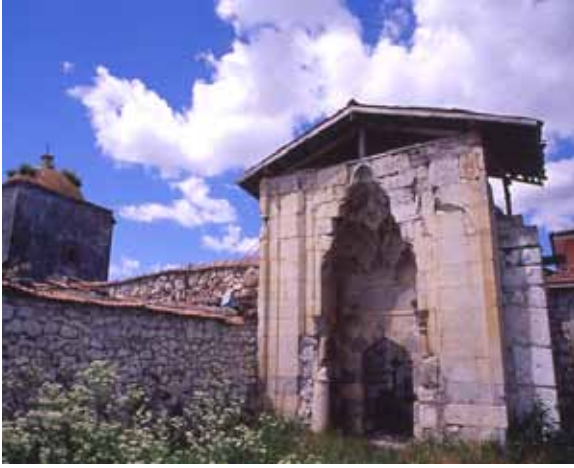
Hüseyingazi Türbesi Hüseyingazi Tomb