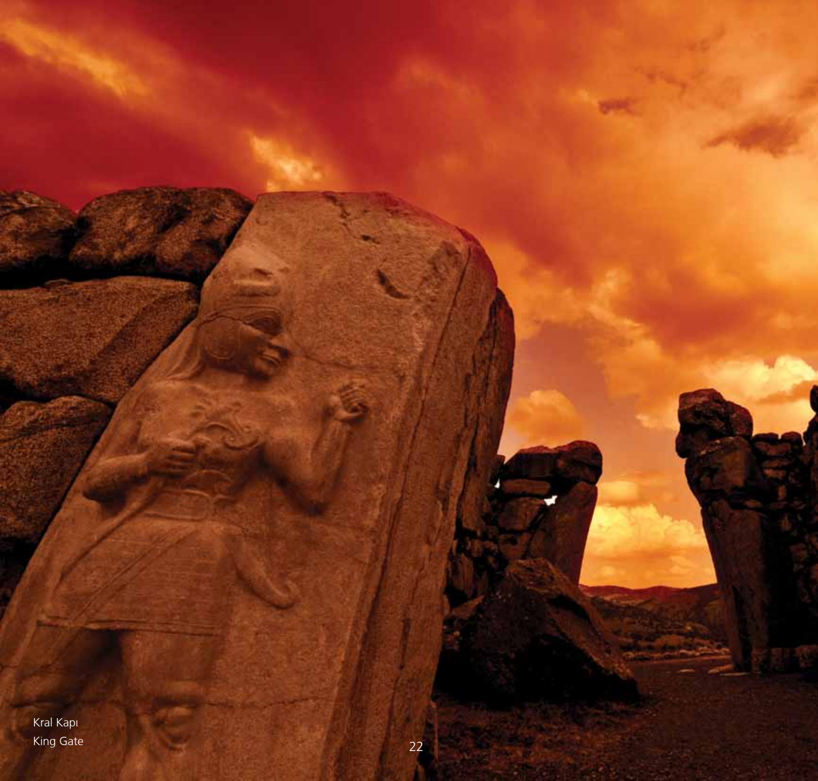
Kral Kapı King Gate