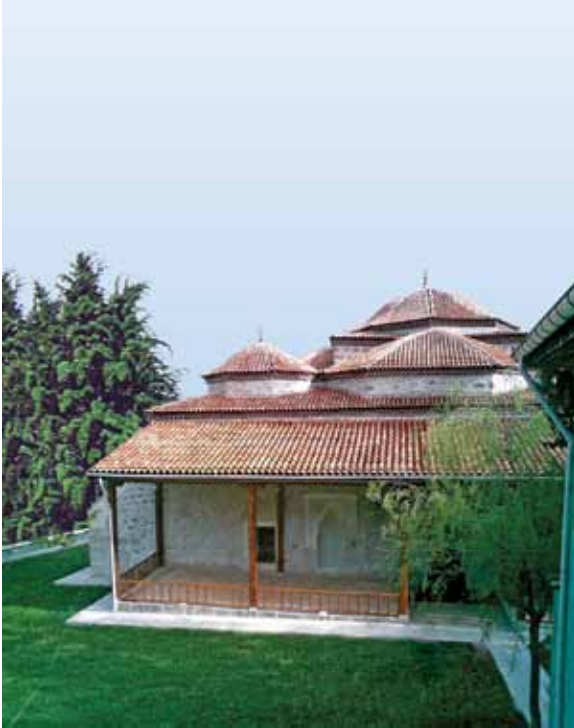
Oğuz Köyü Camii Oğuz Village Mosque