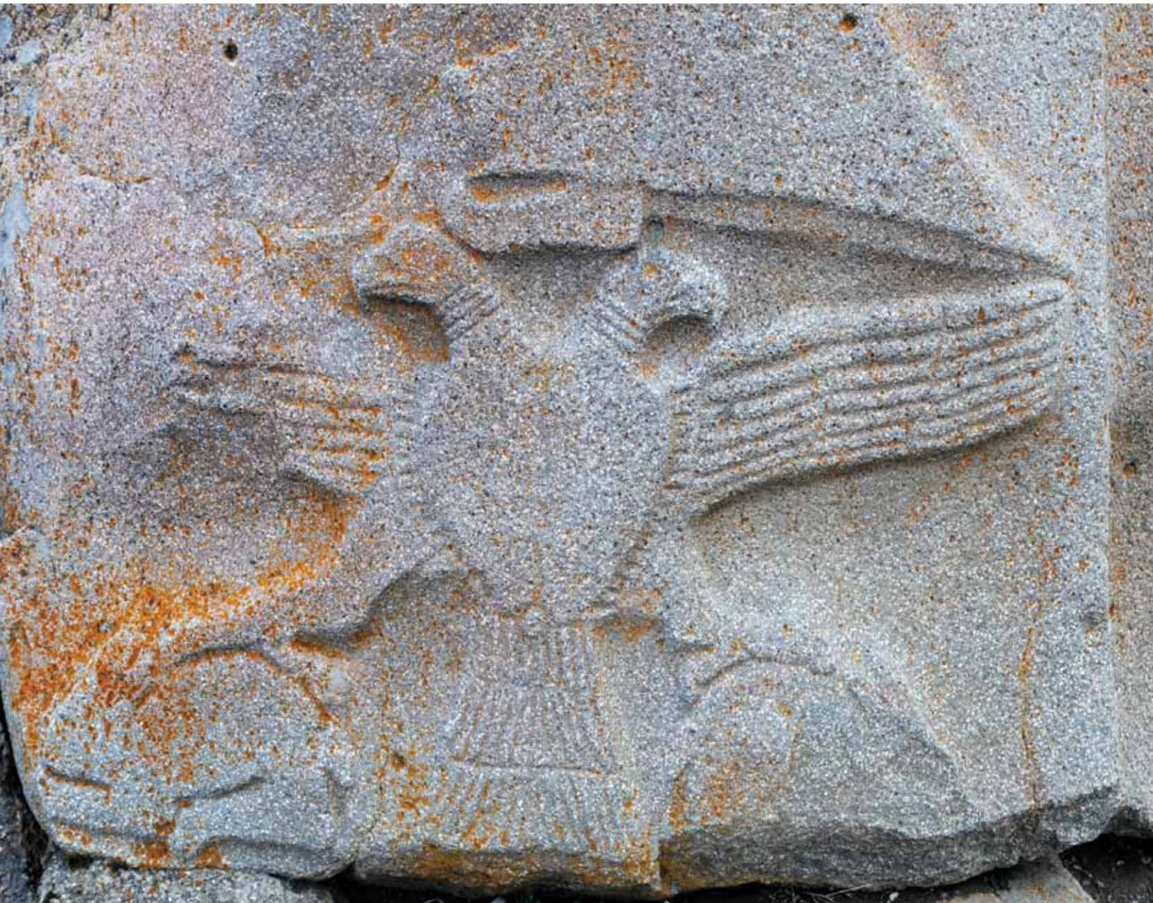
Çift başlı kartal Double headed eagle