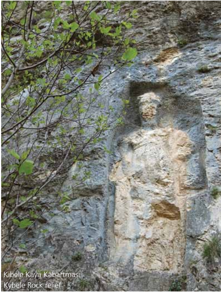
Kibele Kaya Kabartması Kybele Rock relief