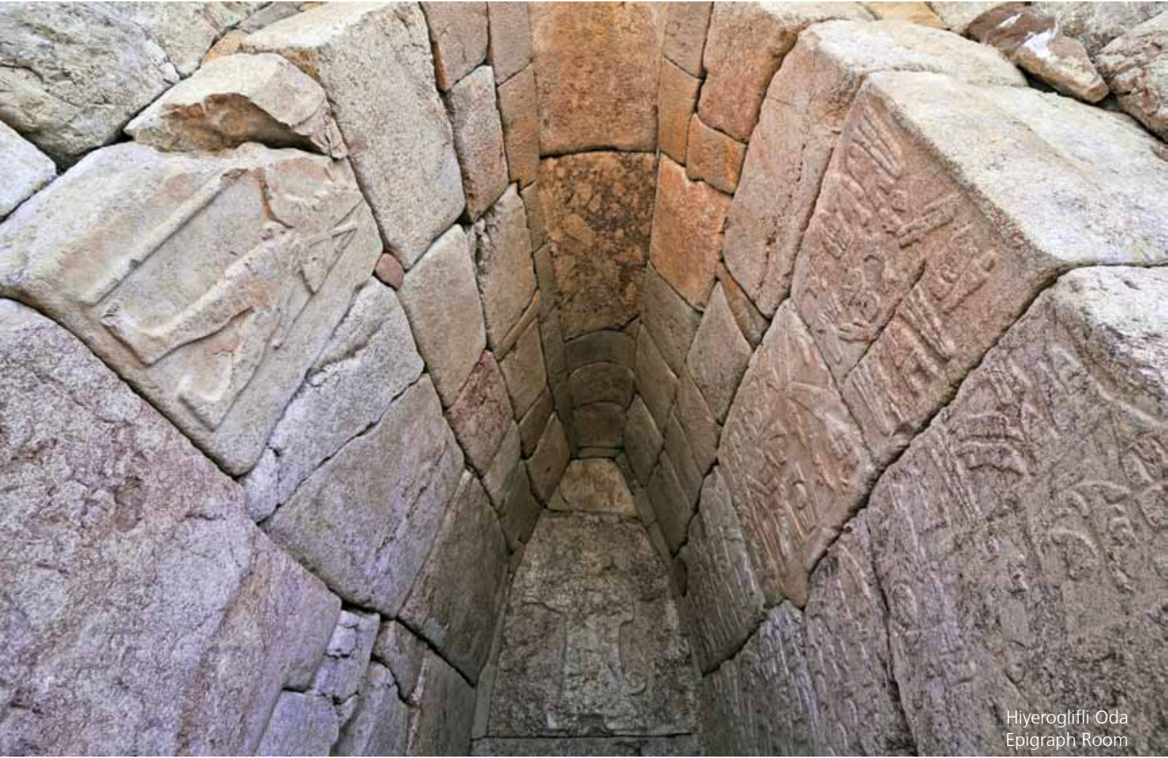
Hiyeroglifli Oda Epigraph Room

Fırtına tanrısı ile Arinna'nın Güneş tanrıçasına adanmış olan Büyük tapınak bulunur. Yazılı kaynaklara göre Hitit tapınakları, yalnız tanrıların evleri değil aynı zamanda kendi toprak ve işlikleri olan ve bunları kendi personeliyle işletilen kurumlardı.