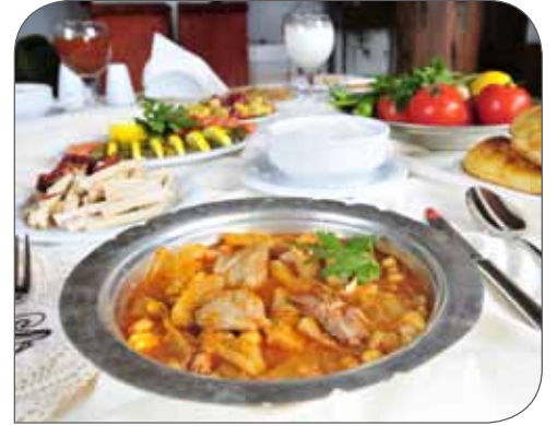
Etli Su Kabağı