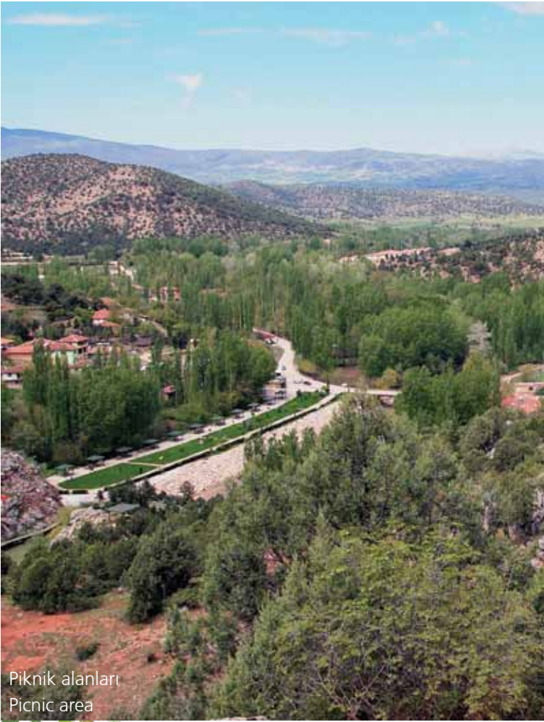
Piknik alanları Picnic area