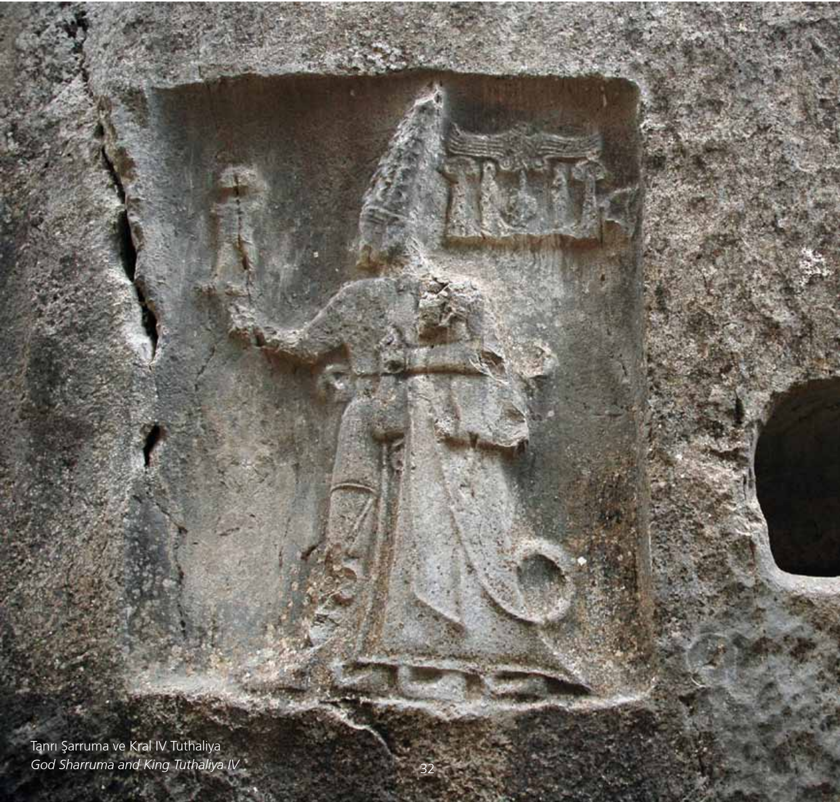
Tanrı Şarruma ve Kral IV Tuthaliya God Sharruma and King Tuthaliya IV