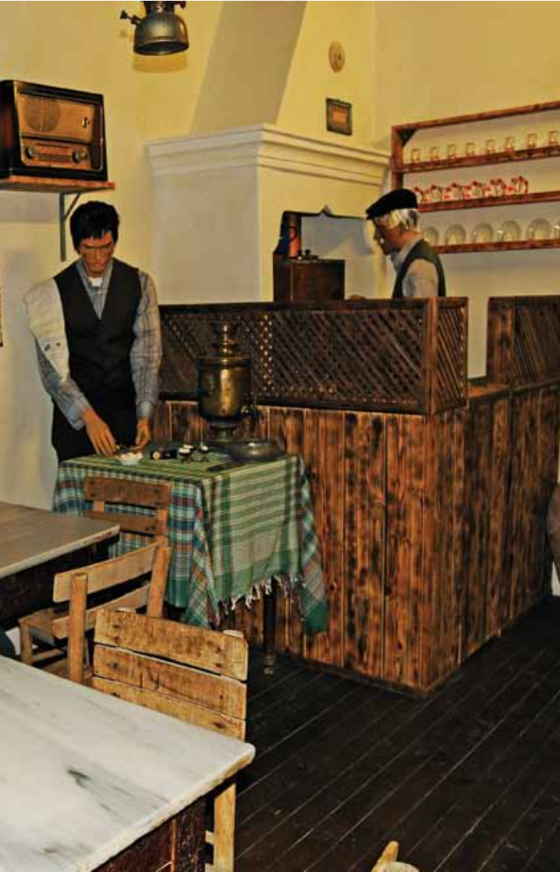
Çorum da kahvehane kültürü (aslına uygun sergilemesi) Faithful presentation of the estaminet culture in Çorum