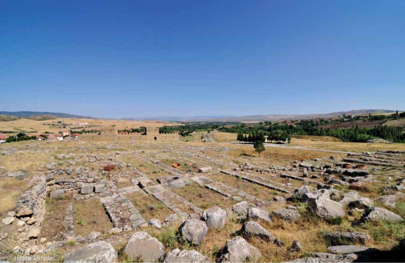
BuYük Mabet Hittite Temple

Hattuşa, Hitit İmparatorluğu'nun hem idari başkenti, hem de ülkenin dini merkeziydi. Hitit metinlerinde Hattuşa Ülkesinden "bin tanrılı ülke" olarak söz edilir. Bu tanrı bolluğu ilginç bir gelenekten kaynaklanır: Hititler diğer ülkelerin, özellikle de yendikleri komşularının tanrılarını kızdırıp gazaplarına uğramaktansa, armağan ve dualarla saygılarını dile getirip onları kendi tanrıları arasına katmayı yeğliyorlardı. Ayrıca her şehrin koruyucu bir tanrısı vardı. İmparatorluğun çeşitli şehirlerinde tapınılan bu tanrılar için de başkentte tapınaklar yaptırılmıştı. Başkent Hattuşa'da bugüne kadar 31 tapınak gün ışığına çıkartılmıştır. Aşağı Şehir'de ülkenin en yüksek tanrıları olan