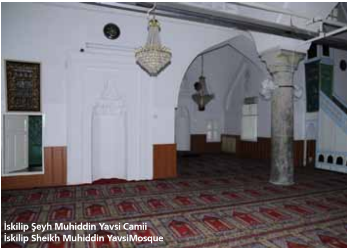
İskilip Şeyh Muhiddin Yavsi Camii İskilip Sheikh Muhiddin Yavsi Mosque

The mosque, which was modeled after the Great Mosque in Çorum, dates back to 1839, the late Ottoman Period. Inside the mosque you can find cufic scripts. The minaret constructed of stone is a remain of the former mosque found there.