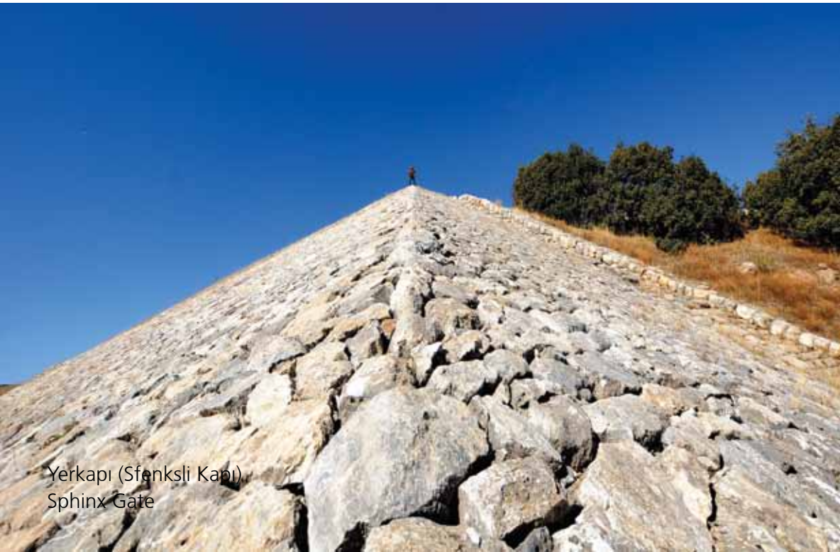
Yerkapı (Sfenksli Kapı) Sphinx Gate

Yer Kapı, Hattuşa'nın en ilginç kalıntılarından. Sur, burada 20 metre yüksekliğinde yapay bir sırt üzerinden geçer. Yapay sırtın şehir dışına bakan eğimli yüzünün 250 m uzunluğundaki kesimi kireçtaşı bloklarla kaplıdır. Kesik pramit biçimli bu oluşumun en üstünde ortada yer alan Sfenksli Kapı ve bunun hemen altında Hattuşa'nın bugün içinden geçilebilen tek poterni (tünel) vardır. 71 metre uzunluğunda ve 3 metre yüksekliğindeki poternden geçilerek sur dışına çıkılmaktadır.