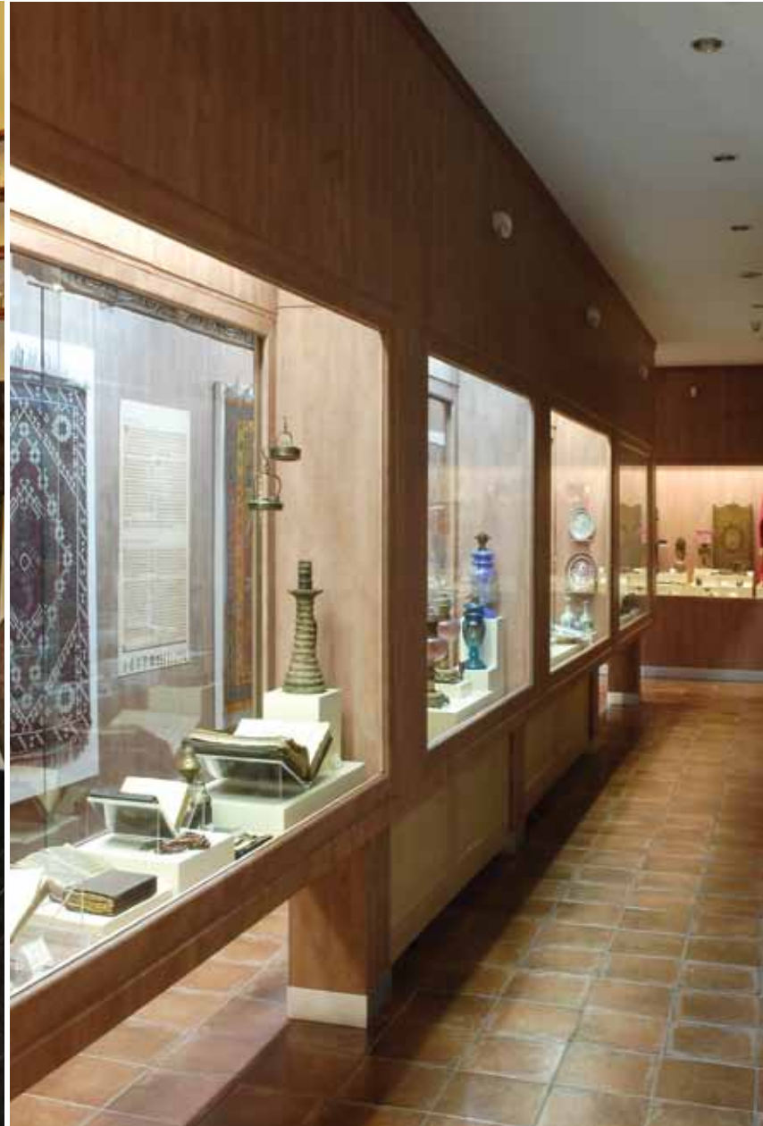
Etnoğrafya salonundan bir kesit A view from the ethnography hall