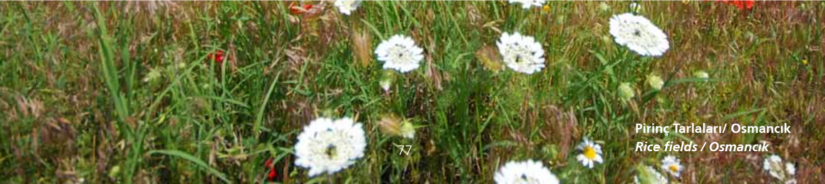
Pirinç Tarlaları/ Osmancık Rice fields / Osmancık

In addition to natural lakes like Dipsiz and Çakır, there are around fifty dams and ponds for irrigation and these lend color to the district with their glowing water. These lakes, which creates imaginary views in their area besides from energy production and irrigation activities, are used as recreation area or walking track and among the places preferred in hand-line fishing, water sports and bird-watching activities. We can list the primary ponds, over which bird bebies wander from time to time, are Obruk, Alaca Evcı, Yenihayat, Hatap, Koçhisar, Gökçedoğan, Kalederesi ve Çorum Baraj gölleri ile Alacahöyük Örukaya, Soğucak, Çatak, Geven, Kızkaraca, Gökbel, Kızılhamza, Oruçpınar, Ortaköy, Köprübaşı, Aksu, Boğazkale, Evciyenikışla and Seydim.