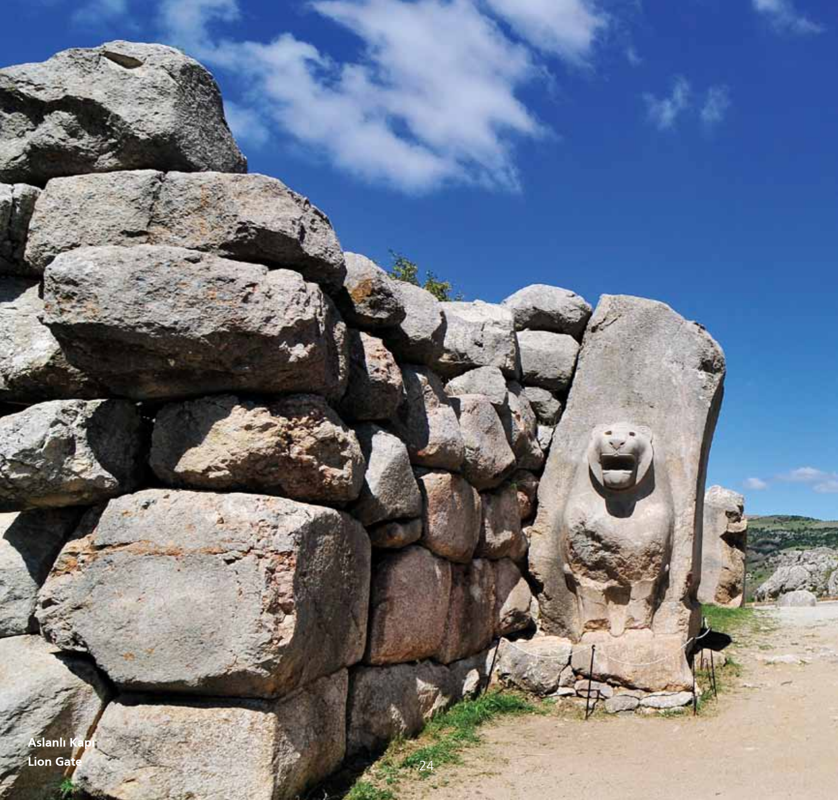
Aslanlı Kapı Lion Gate