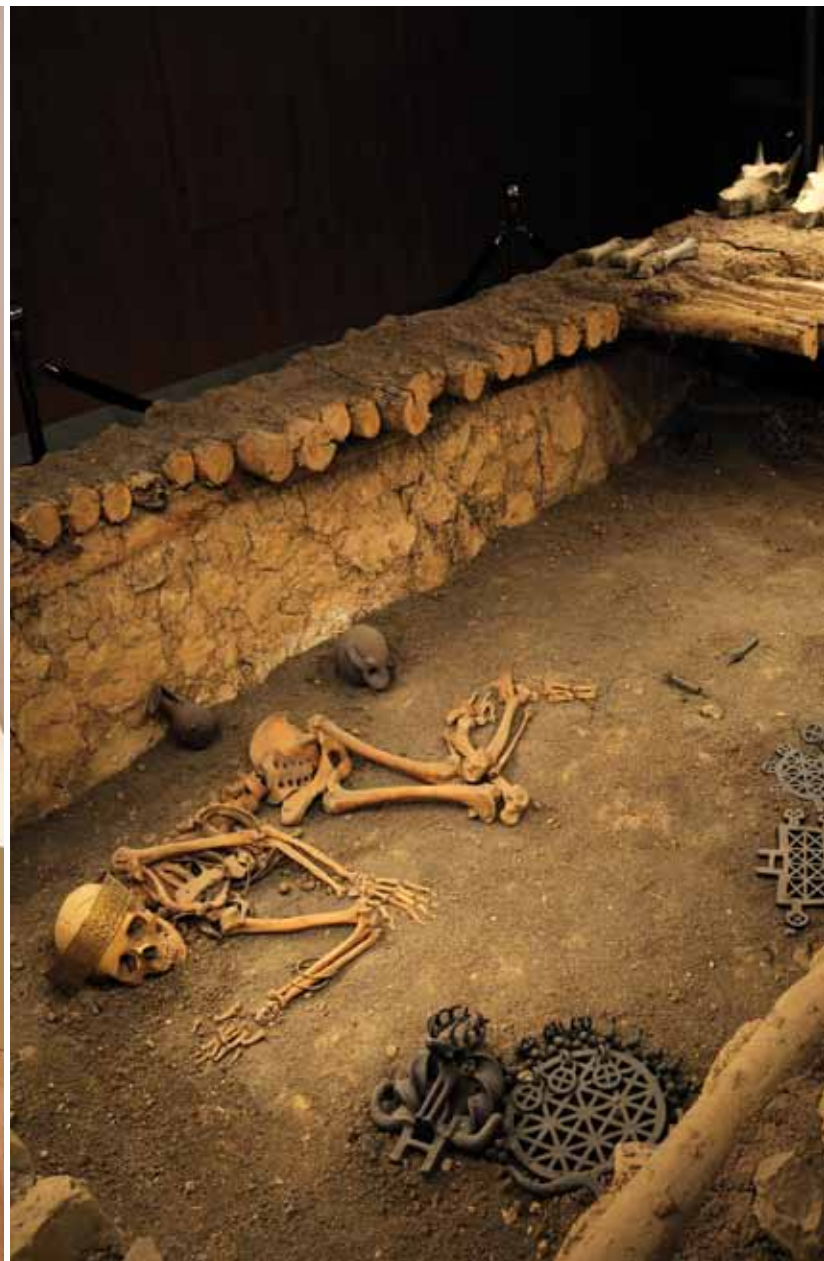
Eski Tunç Çağı Alacahöyük mezarı (aslına uygun sergilemesi) Faithful presentation of the Early Bronze Age Alacahoyuk tomb