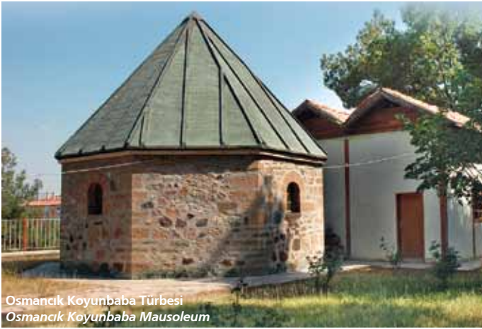
Osmancık Koyunbaba Türbesi Osmancık Koyunbaba Mausoleum