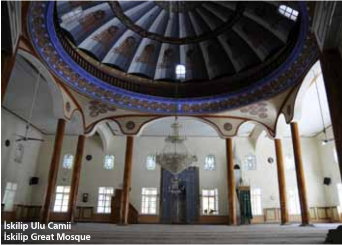
İskilip Ulu Camii İskilip Great Mosque

Geç Osmanlı dönemine tarihlenen ve Çorum Ulu Camii örnek alınarak 1839 yılında yapılan caminin içi kufi yazılarla süslenmiştir. Taştan yapılmış minare daha önce yapılan camiden kalmıştır.