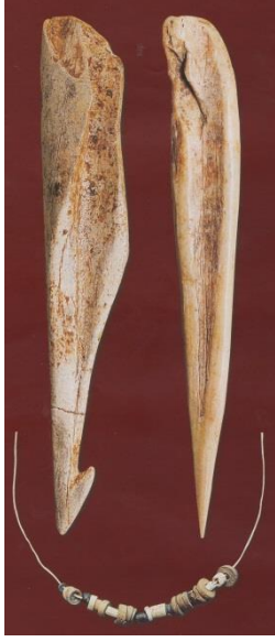
Resim 1: Öküzini Mağarası Epi-paleolitik (Kemik tığ, kemik bız ve boncuklar)