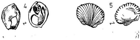
Çizim 3: Epi-paleolitik süs objeleri (Çizim M.Beray Kösem)