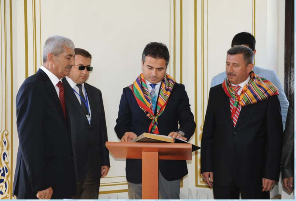
2013 YILINDA Gençlik ve Spor Bakanımız Sayın Suat Kılıç