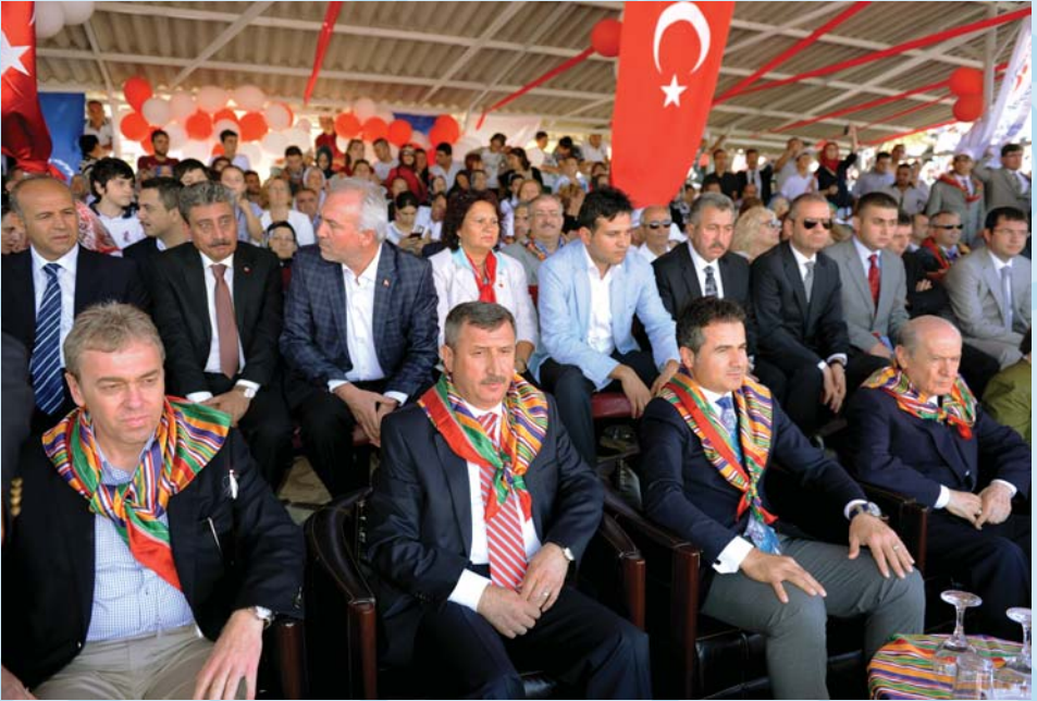
MHP Genel Başkanı Sayın Devlet Bahçeli katılmışlardır.