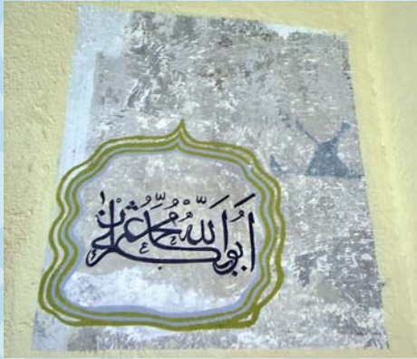
“Allah, Muhammed, Ebubekir, Ömer, Osman, Ali”