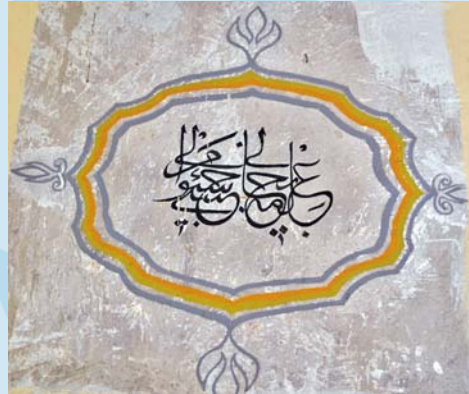
“İlmühübihali hasbi minsüali”