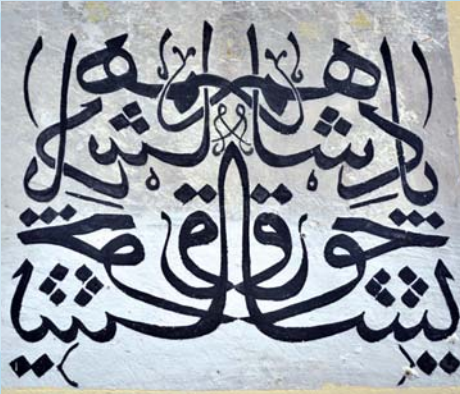
“Padişahım Çok Yaşa”