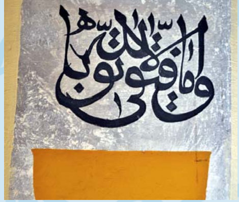
“Vemetevfiki illa billah”