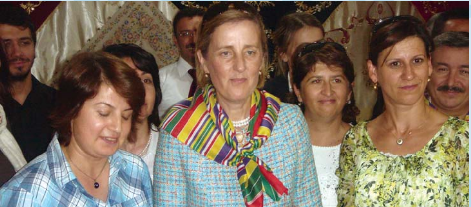
2009 Yılında Kadın ve Aileden sorumlu Devlet Bakanımız Sayın Selma Aliye KAVAF