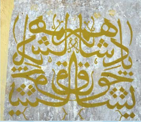
“Padişahım Çok Yaşa”