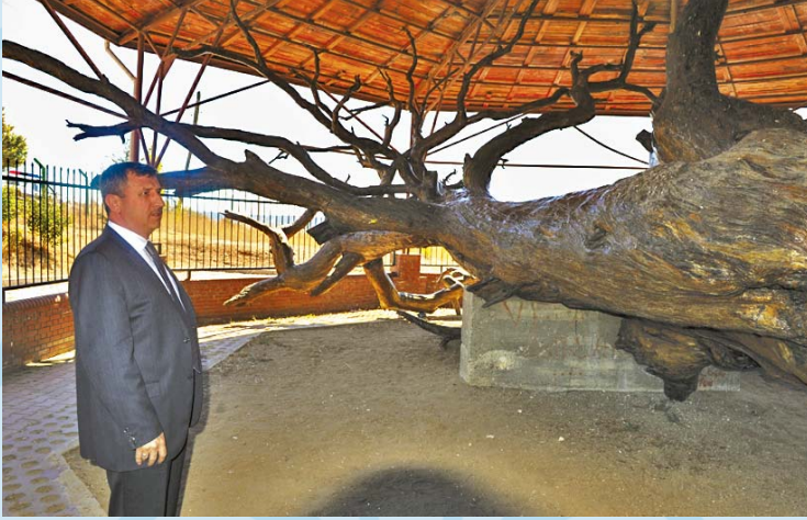
Mızık Çamı (Domurköy)

İlçemiz Domur Köyü Osmanlı Devletinin kurucusu Osman Gazinin babası Ertuğrul Gazinin yazın at koşturduğu bu topraklarda Osman Gazinin babaannesi Hayme Ana'nın torununu salladığı ağaç olarak rivayet edilen yaklaşık 1000 yaşında olan Mızık Çamına sahiptir.