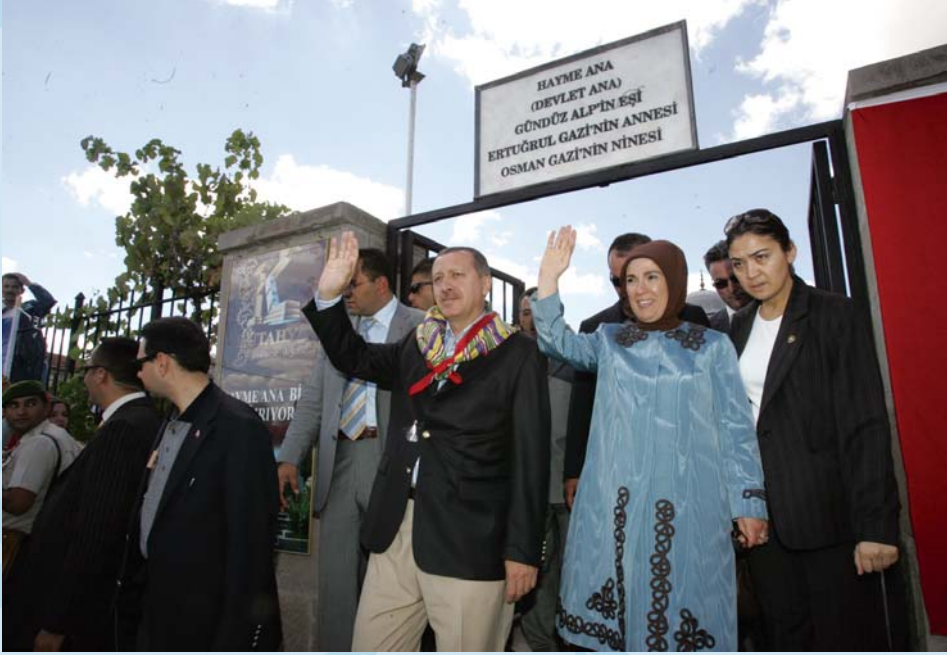
2006 Yılında Başbakanımız Sayın Recep Tayyip ERDOĞAN