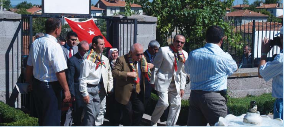
2008 Yılında Türkiye Büyük Meclisi Başkanımız Sayın Cemil ÇİÇEK