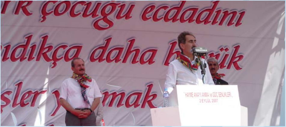
2007 Yılında Kültür ve Turizm Bakanımız Sayın Ertuğrul GÜNAY