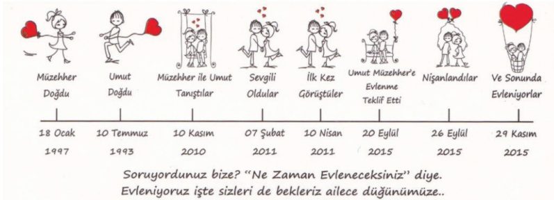
Davetiye 3: Tarih şeridi örneği olan davetiyeler. (Davetiyeçi, 2015).

Bazı davetiyelerde çiftlerin doğumdan düğüne kadar olan süreçleri, çeşitli simge, görsel ve metinlerden hareketle bir tarih şeridi şeklinde verilmiştir. Bu tasarımda davet metni söz konusu içeriklerle desteklenmektedir. Bu semboller genellikle şu ifadeleri yansıtmaktadır: DOĞUM, TANIŞMA, AŞKIN BAŞLAMASI, SEVGİLİ OLMA, GÖRÜŞMELER, ASKERLİK, EĞİTİM YAŞAMI, EVLENME TEKLİFİ, KIZ İSTEME, SÖZ, NİŞAN, EVLİLİK.