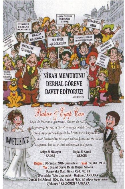
Davetiye 2: 06 Şubat 2016 tarihli düğün davetiyesi, (Davetiyeci, 2016).

Çiftin düğün davetiyesinde yer alan "davet metni" şöyledir: "Leyla ile Mecnun'u görmemiş, Kerem Aslı'yı duymamış, Ferhat ile Şirin'i bilmiyor olabilirsiniz. Titanîği de seyretmediyseniz bu fırsatı sakın kaçırmayın. Hayat limanından başlayan yolculuğumuzda mutluluğa uçuyoruz. Sizi de en özel anlarımıza bekliyoruz" (Davetiyeci, 2016).