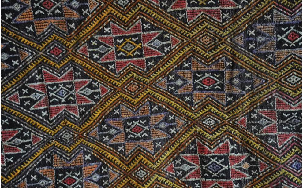
Fotoğraf 3. Sarı çatkılı-yıldızlı çulun desen detayı.

ulgamalı-tegelli 2 olarak bilinmektedir. Sözkonusu yangışlı-nağışlı kilim ya da çullarda en önemli bezeme unsurlarından biri sekiz köşeli 3 yıldız yangış ıdır. Sadece Burdur Müzesindeki zili-sili dokuma örnekleri içinde bu yangışın, belirlenebilen dört çeşit düzenlemesi mevcuttur. Özel koleksiyonlarda birkaç farklı kompozisyona da rastlanmıştır. Sekiz köşeli yıldız bezemeleri Akdeniz bölgesi halı, kilim, çul-zili vb. dokumalarda ise göz motifi ile birlikte çok yaygın görülmektedir.