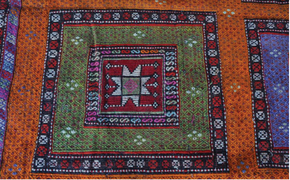
Fotoğraf 5. Sandıklı-kapılı Kilim bezeme detayı.