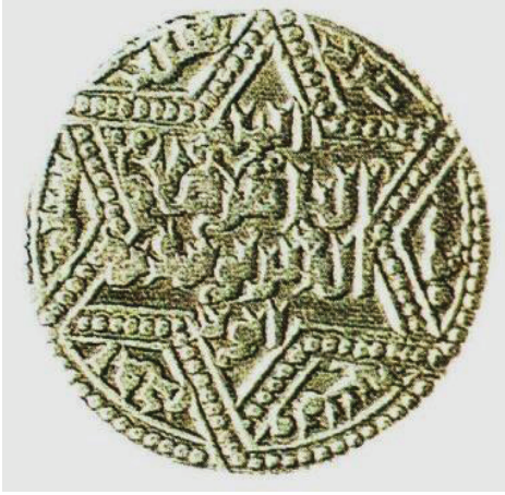
Fotoğraf 1. Altı köşeli yıldız bezekleri, Selçuklu sikkesi(Parlar, 2001:152)