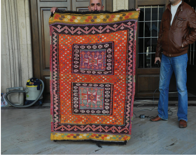
Fotoğraf 7. İki kapılı namazlağı, Burdur Müzesi, Env:Et.80.49.83.