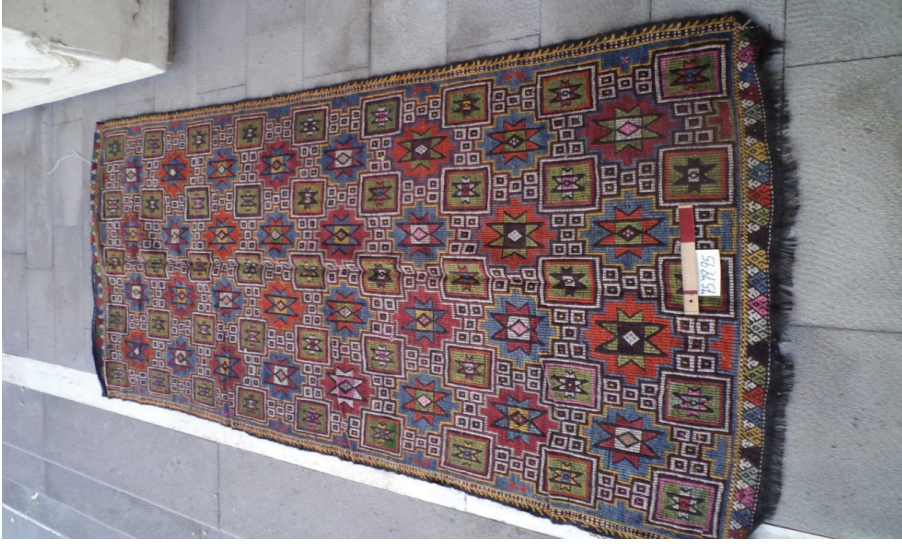
Foto raf 10. Aynalı yıldızlı zili-G kl  haba, Burdur M zesi, Env;75.79.95.

Zemin; merkezi 12 k şeli g l , aralarda kare  er eve i inde sekiz k şeli yıldız ve bo lukları dolduran be li g z motiflerinin uyumlu d zeniy le meydana getirilmi tir. Yatay ve dikey y nde tam simetri (ayna) olu turdu u i in aynal -yıldızlı zili adını almı tır. Kısa kenar suyuunda ku  aya ı ve elibeline yangı ları ile d rt kenarı  er eveleyen tırnak yangı lı kenar suyu yer alır. Bu kenar suları y rede en yaygın uygulanan kenar suyudur.