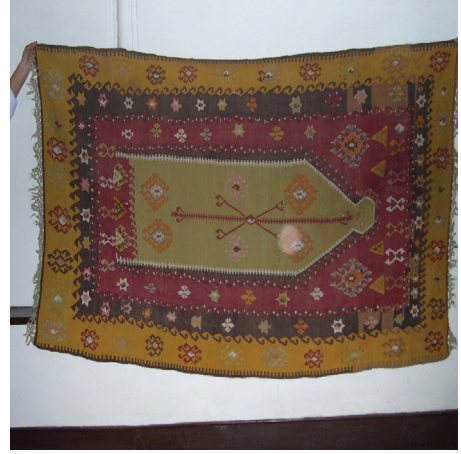
Fotoğraf 2. Kenar suyunda altı köşeli yıldız içinde aşık kıvrımı bezemeli kilim seccade detayı, Yozgat müzesi, (A. Soysaldı arşivi).

Her iki yıldız da iki geometrik şeklin iç-içe geçmesiyle tamamlanmaktadır. Bu kare ve üçgenlerden biri göğü; yani ruhu, manevi güçleri, diğeri yeri; yani maddeyi-varlığı temsil etmektedir. Denge(ying-yang)-âşık kıvrımı; zıtlıkların birlikteliği ile dengeyi, hayatı sembolize etmektedir. Ruh ve beden gibi... Ruhsuz bedende, bedensiz ruhta bir hayat emaresi yoktur. Dolayısıyla hayat zıtlıkların birlikteliğindedir. Bu nedenle olsa gerek Türk kilimlerinde yıldız (mühr-ü Süleyman) içinde denge-âşık kıvrımı motifine İç Anadolu ve Balkanlarda sıkça karşılaşılmaktadır (fotoğraf 5). Sekiz köşeli (Selçuklu) yıldız yangışı da Türk dünyası halı, kilim, cecim-cicim, zili vb. dokumalarda oldukça yaygın görülmektedir.