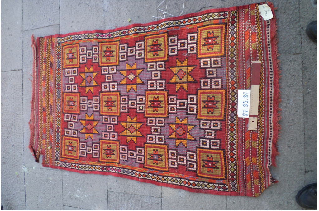
Fotoğraf 9. Aynalı-yıldızlı namazlağı, Burdur Müzesi, Env; 87.83.80.