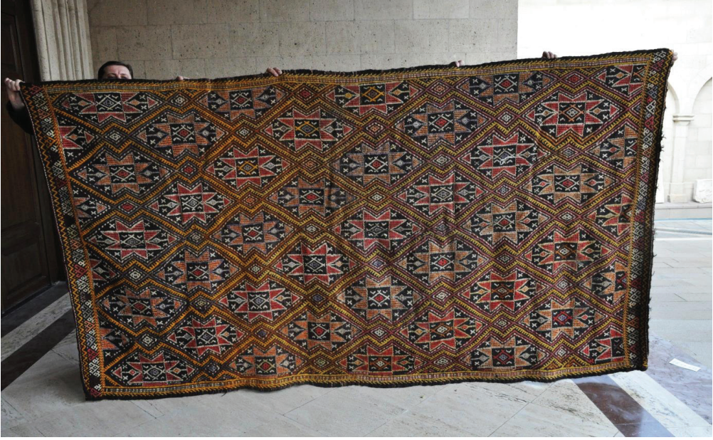
Fotoėraf 4.  atklı-yıldızlı  ul, Burdur M zesi, Env: Et 165.67.87.

Ayrıca  ul eli belinde, eėri yangıřlı kısa kenar ve tırnak yangıřlı yan kenar suyu ile  er evelenmiřtir.