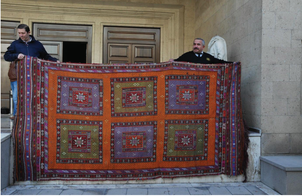
Fotoğraf 6. Altı kapılı kilim, Burdur M zesi, Env; Et 49.34.83.

M zeeye geliři : 2.11.1983(Burdur, Ali  zse en-G lhisar)